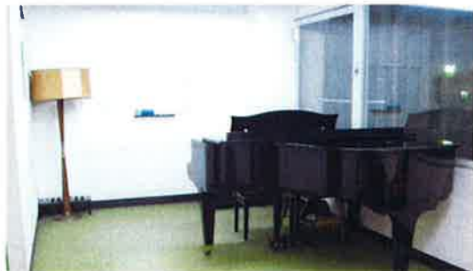
レッスンスタジオ 第5