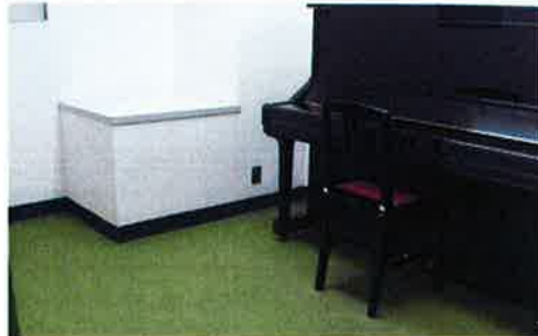
レッスンスタジオ第6-8