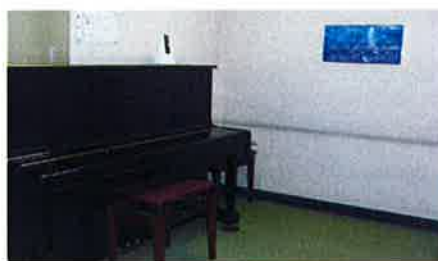
レッスンスタジオ第1-4